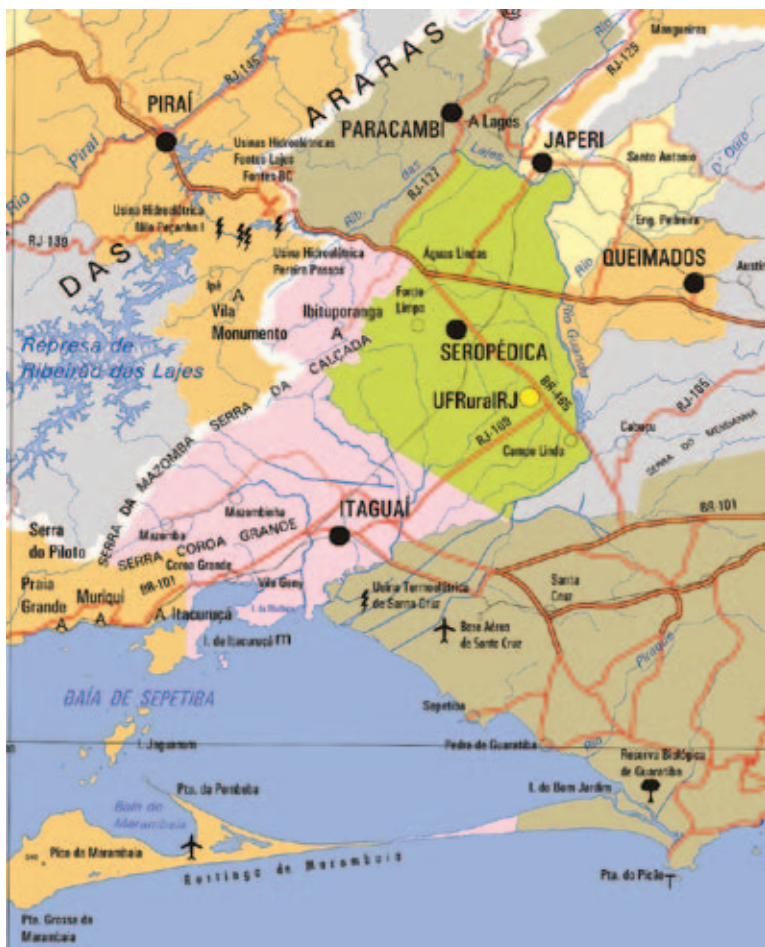
Figura 1 Localização das unidades escolares participantes do projeto “O Ciclo das Rochas em Terras Fluminenses” em 2010. Base cartográfica: Departamento de Estradas e Rodagem (2006)

O projeto envolveu nove escolas vinculadas a Secretaria de Estado de Educação, em quatro municípios (Figura 1), situados no entorno do campus universitário da Universidade Federal Rural do Rio de Janeiro (UFRuralRJ). A participação no